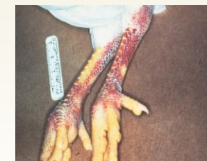
त्वचा और पैरों में रक्तस्राव HPAI विषाणु से संक्रमित पक्षियों के लक्षणों में से एक है।