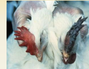
USDA फाइल फोटो कलगी में बैंगनी धब्बे होना HPAI का संकेत हो सकता है।