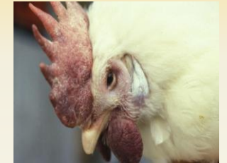
HPAI से ग्रस्त पक्षी के सिर, मांस तंतु, कलगी और चेहरे पर सूजन हो सकता है।