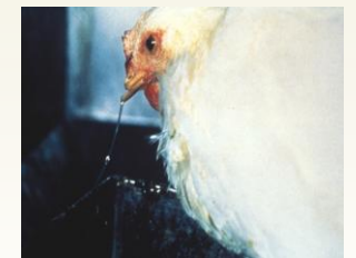
नाक से स्राव (नाक बहना) HPAI का एक लक्षण हो सकता है।